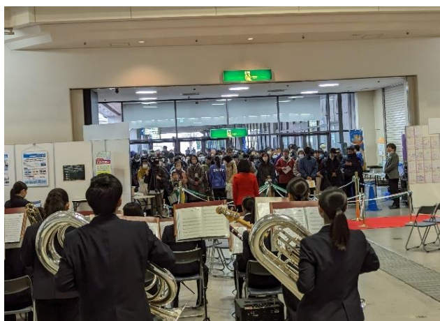
オープニングセレモニー（地元高校 吹奏楽部）